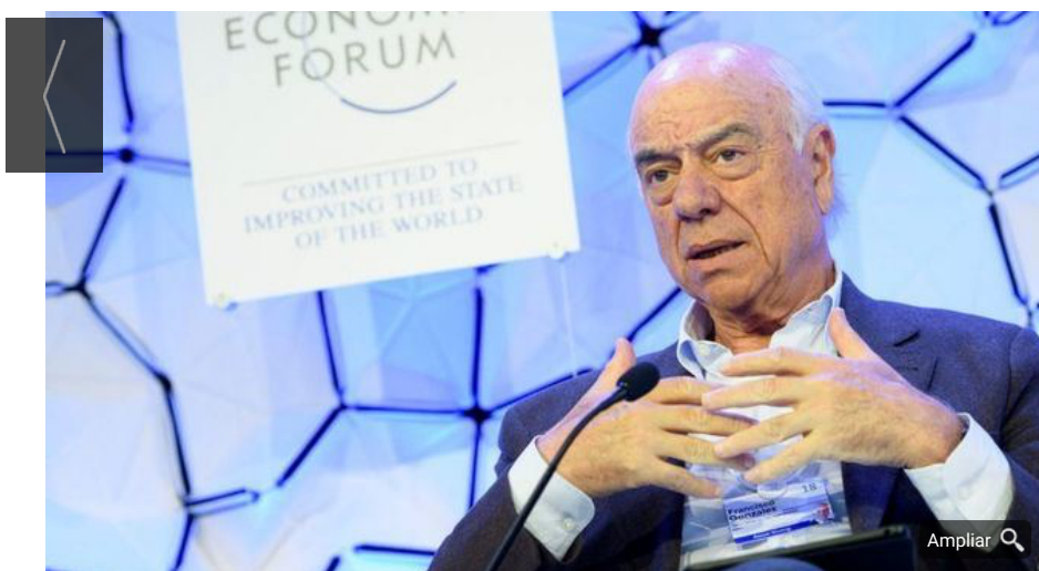
Francisco González, expresidente de BBVA

En la querrela, el abogado señala que los hechos son cuanto menos constitutivos de los presuntos delitos de cohecho activo, revelación de secretos y corrupción en los negocios.